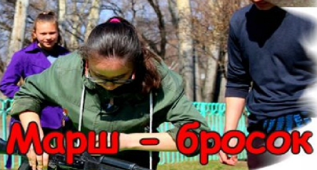
Марш - бросок 10 стр.