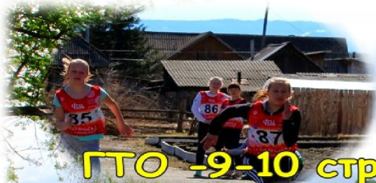
ГТО -9-10 стр.