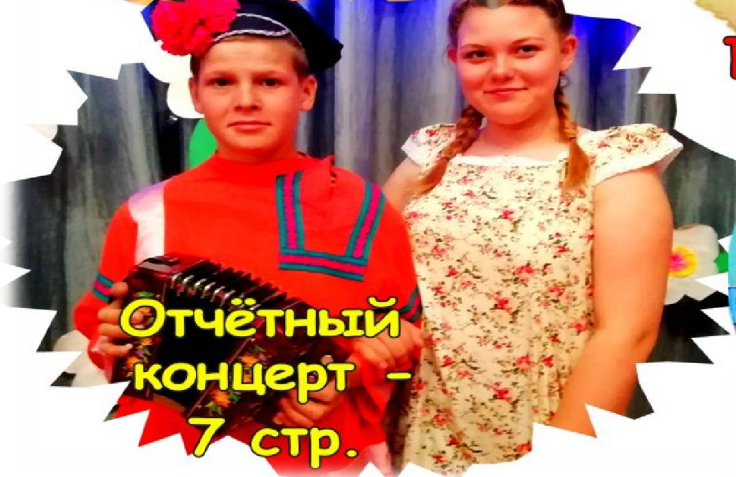
Отчётный концерт - 7 стр.