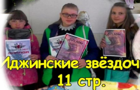
Иджинские звёздочки 11 стр.