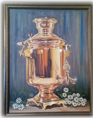
Звада Анастасия Сергеевна, педагог - библиотекарь