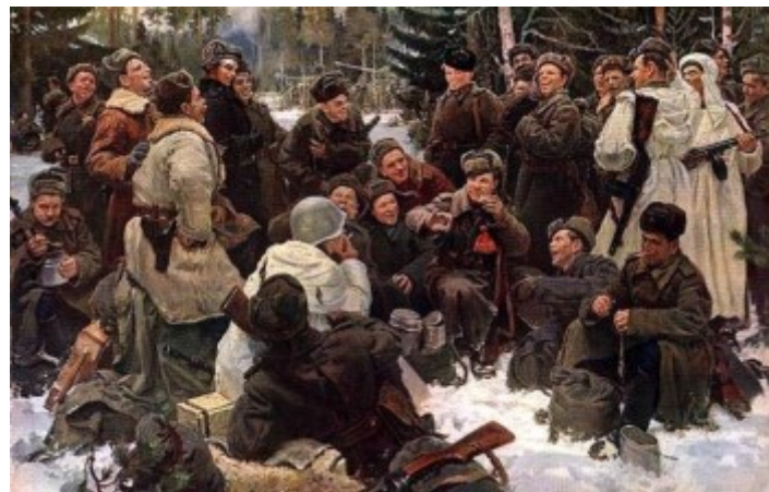
Художник Ю. М. Непринцев: Отдых после боя. Холст, масло.

Государственная Третьяковская галерея, Москва