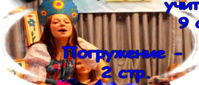
Погружение - 2 стр.