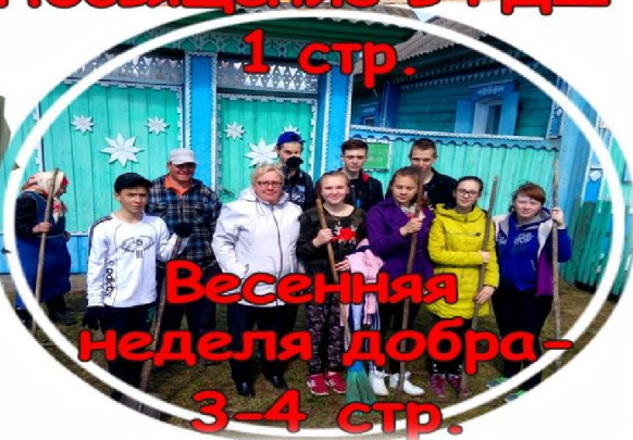
Весенняя неделя добра - 3-4 стр.