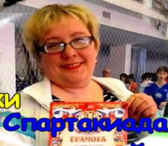
Спартакиада учителей - 9 стр.