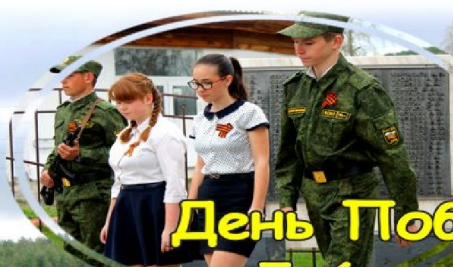
День Победы 5-6 стр.