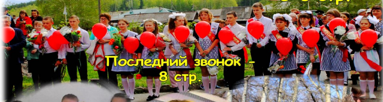
Последний звонок - 8 стр.